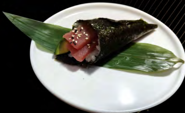
105. TONNO AVOCADO tuna avocado € 5,00 allergeni: 4,11