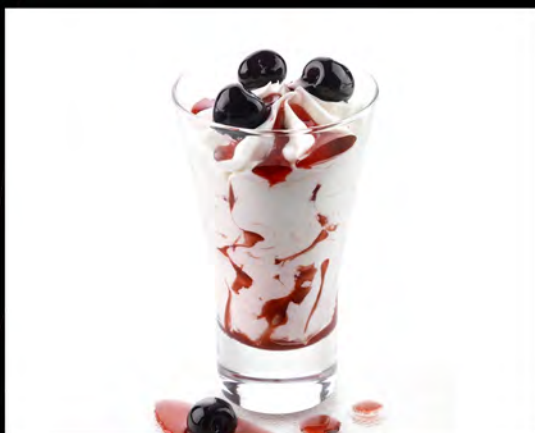
COPPA SPAGNOLA € 6,00 Spanish cup