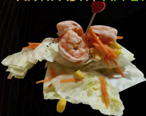
05. INSALATA CON GAMBERI € 7,00 insalata mista con gamberi e salsa giapponese mixed salad with shrimps and Japanese sauce allergeni: 1,2,6,11