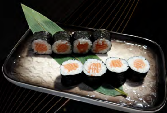
93. SAKE MAKI € 4,50 salmone salmon allergeni: 4