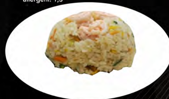
25. RISO SALTATO CON GAMBERI E VERDURE

€ 5,50 pollo, verdure, uovo chicken, vegetables, egg allergeni: 3