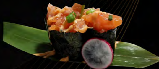
116. SPICY SALMONE € 4,00 tartare di salmone, salsa piccante, erba cipollina Salmon Tartare, spicy sauce, chives allergeni: 3,4