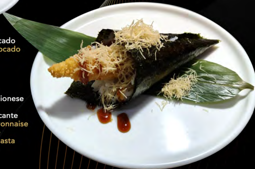
107. EBITEN € 4,50 gambero fritto, maionese con salsa teriyaki fritti di pasta croccante fried shrimps, mayonnaise with teriyaki sauce crispy strands of pasta allergeni: 1,2,3,6