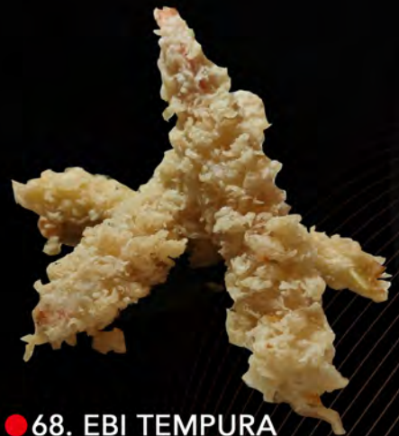
● 68. EBI TEMPURA € 10,00 gamberi shrimp allergeni: 1,2