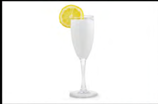
SORBETTO AL LIMONE € 4,50 lemon sorbet