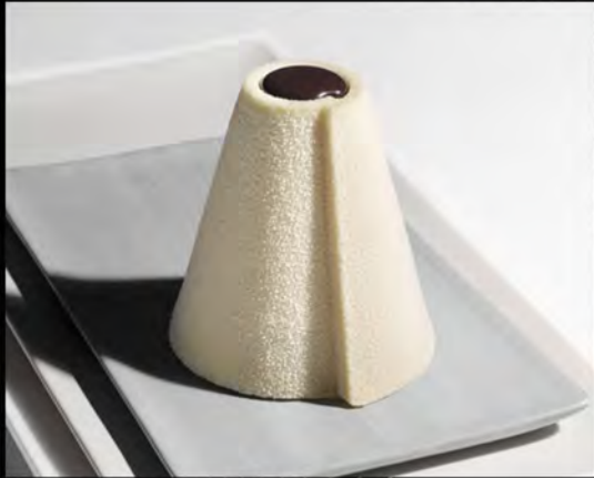
GIROTONDO ALLE MANDORLE € 7,00 almond cake