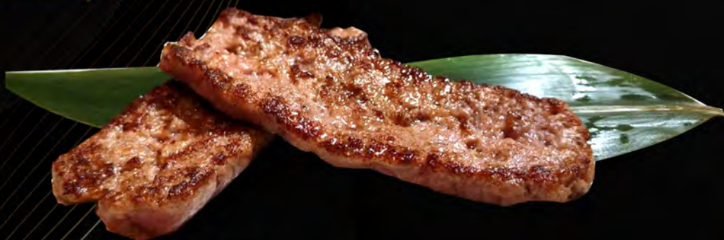
77. SALSICCIA € 7,00 con semi di sesamo sausage with sesame seeds allergeni: 1