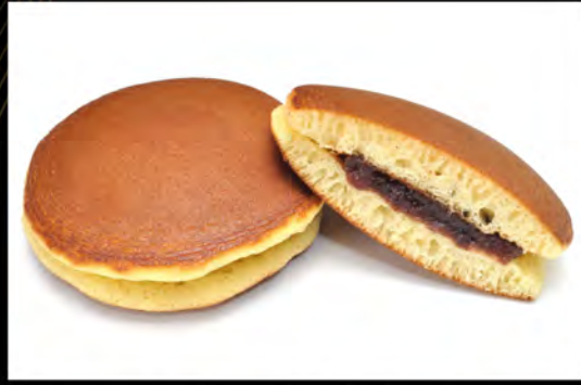
DORAYAKI CON NUTELLA € 4,50 dorayaki with nutella