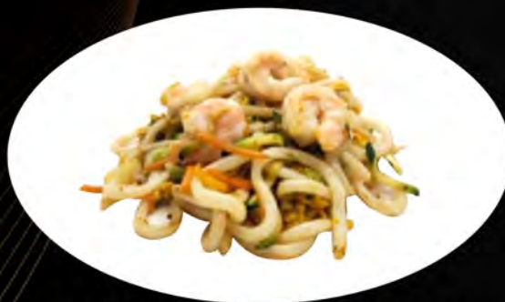
31. YAKI UDON SALTATO CON GAMBERI E VERDURE € 7,00 verdure,gamberi,uova vegetables, shrimps, eggs allergeni: 1,2,3,4,5,7,8,11