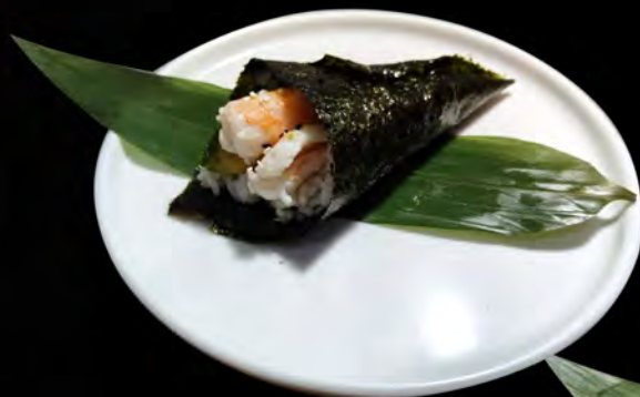
106. EBI MAKI € 4,00 gambero cotto, avocado cooked shrimps, avocado allergeni: 2,11