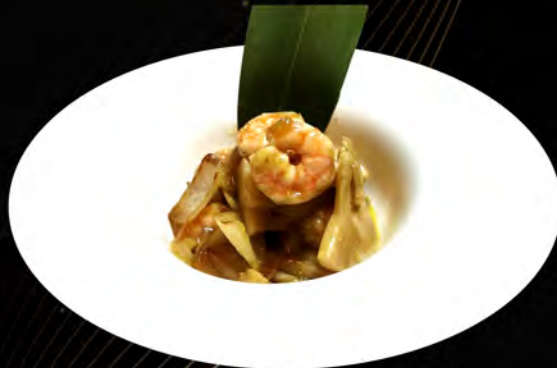
50. GAMBERI AL CURRY Curry Shrimps € 7,00 allergeni: 2