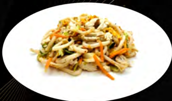
32. YAKI UDON SALTATO CON POLLO E VERDURE € 7,00 verdure,pollo,uova vegetables, chicken, eggs allergeni: 1,2,3,4,5,7,8,11