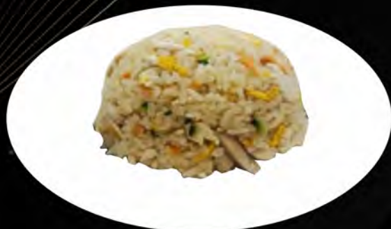
24. RISO SALTATO CON POLLO E VERDURE

prosciutto, piselli, uova ham, peas, eggs allergeni: 1,3