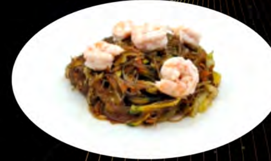
37. SPAGHETTI DI SOIA SALTATI CON GAMBERI E VERDURE € 5,50 gamberi,verdure soia noodles with shrimp, vegetables allergeni: 1,4,6,14