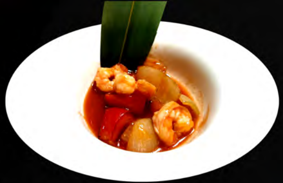
49. GAMBERI IN SALSA CHILI shrimp in chili sauce € 7,00 allergeni: 1