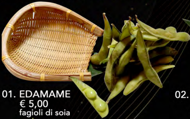
01. EDAMAME € 5,00 fagioli di soia soybeans allergeni: 6