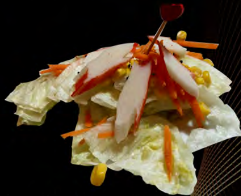
06. INSALATA CON SURIMI DI GRANCIO € 6,00 insalata mista con surimi di granchio e salsa giapponese mixed salad with surimi di crab and Japanese sauce allergeni: 1,2,6,11