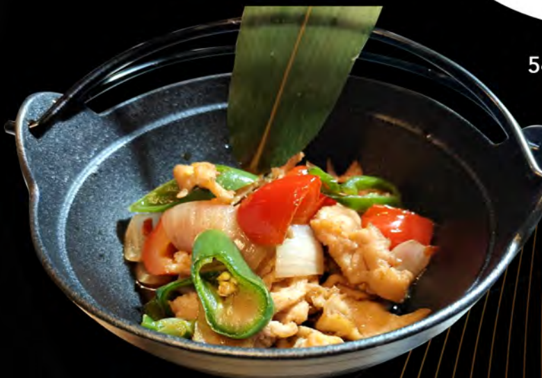
59. POLLO GANGUO STYLE € 6,50 pollo saltati con verdure e salsa piccante serviti in pentola d'acciaio su fiamma libera sautéed chicken with vegetables and spicy sauce served in a steel pot over an open flame allergeni: 1,2,6,14