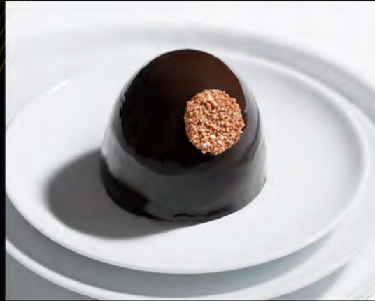
VENERE NERA € 7,00 black venus