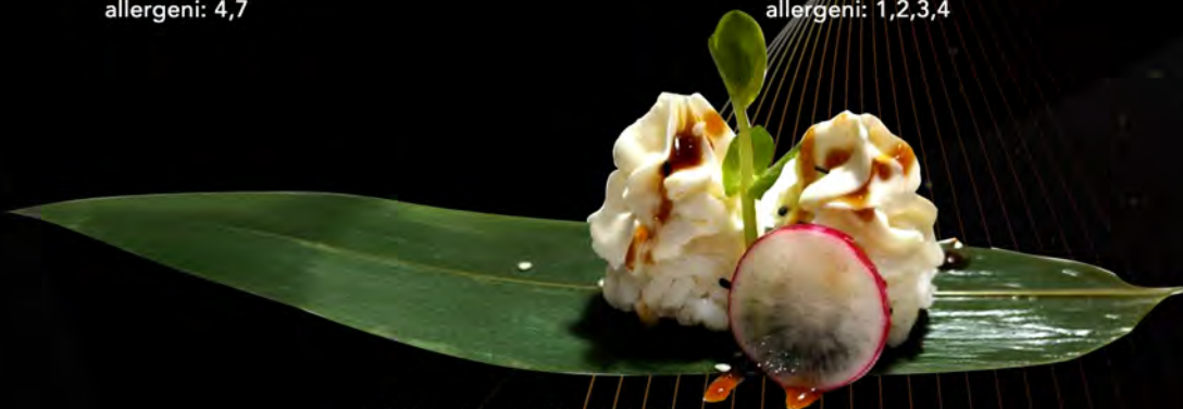
124. WHITE € 3,00 philadelphia Philadelphia allergeni: 7