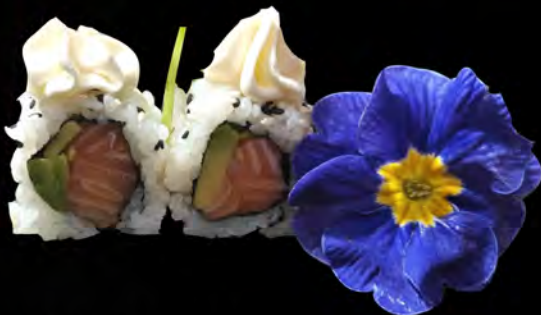
144. PHILADELPHIA SALMONE € 10,00 salmone,philadelphia, avocado semi di sesamo salmon, philadelphia, avocado sesame seeds allergeni: 4,7,11