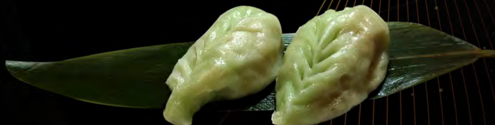
15. RAVIOLI DI VERDURE € 4,50 dumpling filled with vegetables allergeni: 1,6,14