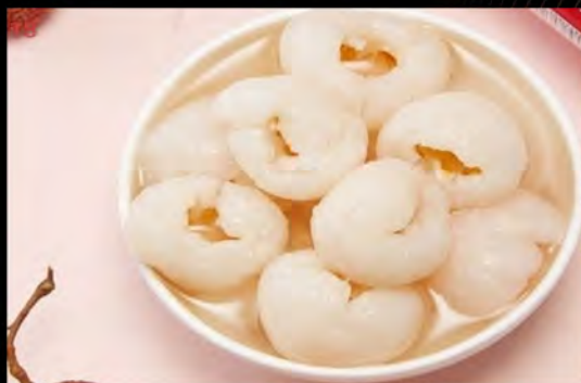
LICHI € 5,00 lichi