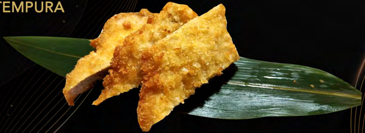
65. COTOLETTA DI SUINO € 8,00 pork cutlet allergeni: 1,3