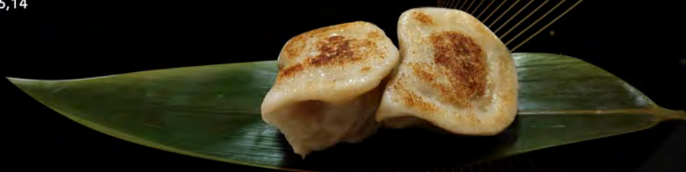
14. RAVIOLI ALLA GRIGLIA € 5,00 grilled dumpling filled with meat allergeni: 1,6,14