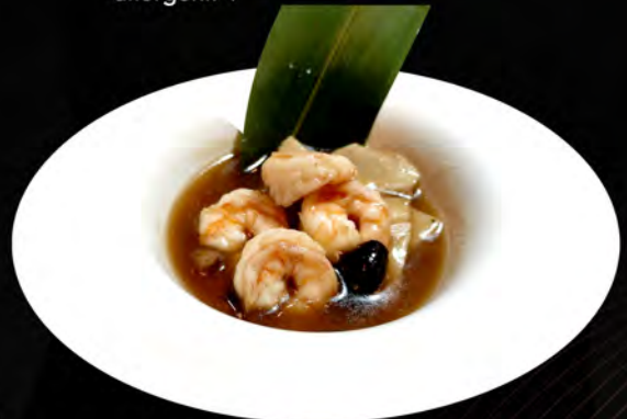
51. GAMBERI CON BAMBU E FUNGHI shrimp with bamboo and mushrooms € 7,00 allergeni: 1,2,6,14