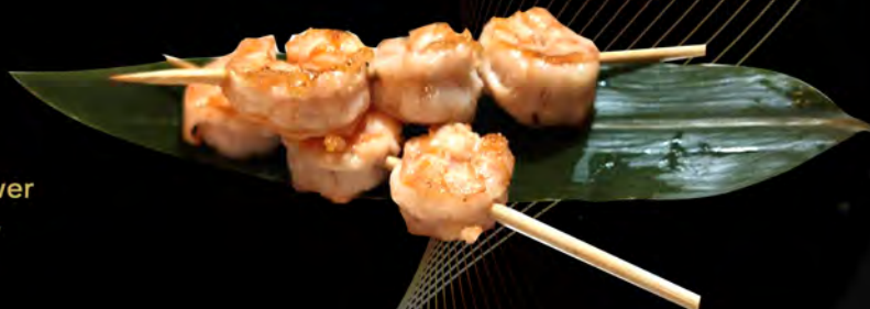
79. SPIEDINI DI GAMBERI € 8,00 con salsa teriyaki, semi di sesamo grilled shrimp skewer with teriyaki sauce, Sesame seeds allergeni: 2,6,11