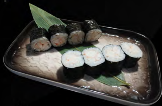
95. EBI MAKI € 4,00 gambero cotto cooked shrimp allergeni: 2