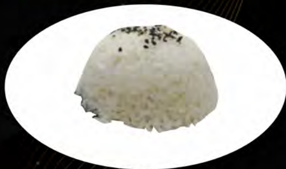
22. RISO BIANCO € 2,50