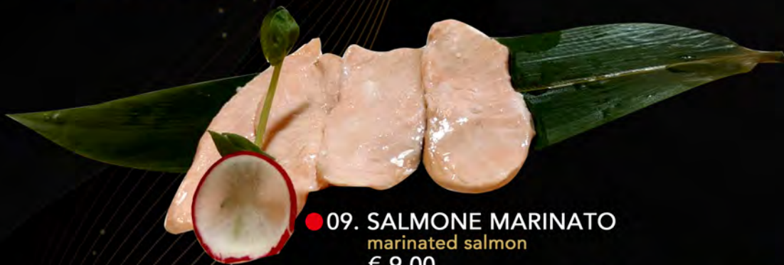
● 09. SALMONE MARINATO marinated salmon € 9,00 allergeni: 4