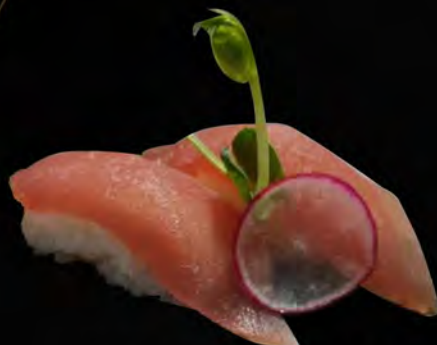
109. TONNO € 4,00 tuna allergeni: 4