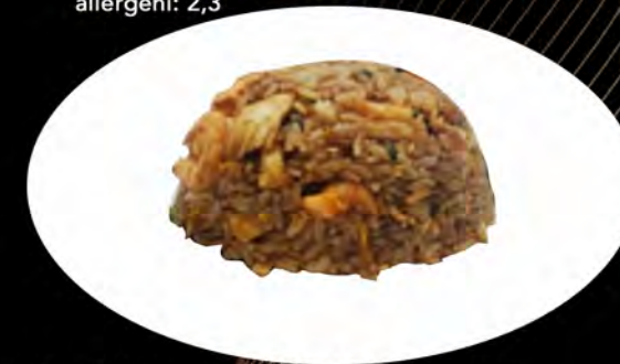
27. RISO SALTATO CAO LAW FAN

€ 6,00 salmone, verdure, uovo salmon, vegetables, egg allergeni: 1,3,4,6,14