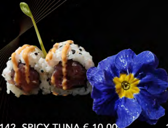
142. SPICY TUNA € 10,00 tartare di tonno,salsa piccante maionese,semi di sesamo tuna tartare, spicy sauce mayonnaise, sesame seeds allergeni: 3,4,11