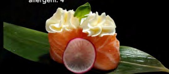
121. SALMONE PHILADELPHIA € 5,00 salmone all'esterno con philadelphia salmon outside with philadelphia allergeni: 4,7