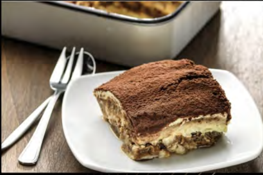
TIRAMISÙ DELLA CASA € 5,00 Homemade tiramisu