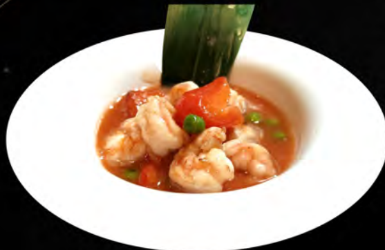
52. GAMBERI IN AGRODOLCE shrimps in bitter-sweet € 7,00 allergeni: 2