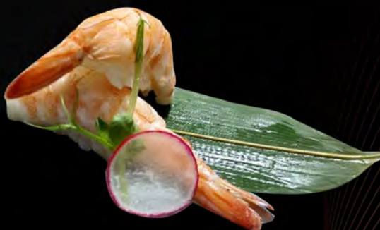
111. GAMBERO COTTO cooked shrimps € 3,00 allergeni: 2