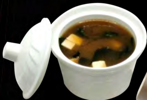
19. ZUPPA MISO € 5,00 tou-fu, alghe tofu, seaweed allergeni: 1