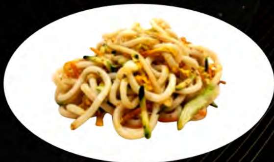
30. YAKI UDON SALTATO CON VERDURE € 6,00 verdure,uova vegetables, eggs allergeni: 1,2,3,4,5,7,8,11