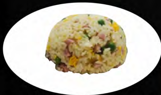
23. RISO ALLA CANTONESE € 5,50

prosciutto, piselli, uova ham, peas, eggs allergeni: 1,3