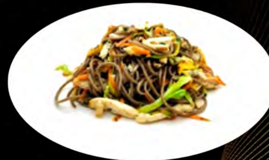
35. YAKI SOBA SALTATO CON POLLO E VERDURE € 7,00 spaghetti di grano saraceno,verdure pollo,uova buckwheat spaghetti, vegetables, chicken, eggs allergeni: 1,2,3,4,5,7,8,11