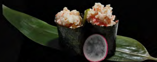
119. GRANCHIO € 4,00 granchio, surimi, maionese crab, surimi, mayonnaise allergeni: 1,2,3