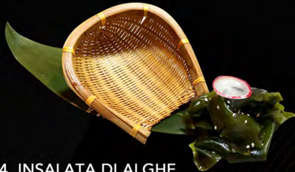
04. INSALATA DI ALGHE € 5,00 seaweed salad allergeni: 6,11