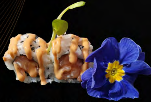
141. SPICY SALMONE € 10,00 tartare di salmone,salsa piccante maionese,semi di sesamo salmon tartare, spicy sauce mayonnaise, sesame seeds allergeni: 3,4,11