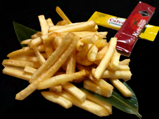
67. PATATINE FRITTE french fries € 4,00