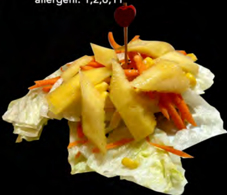
07. INSALATA CON MANGO € 6,00 mixed salad with mango and mango sauce allergeni: 3