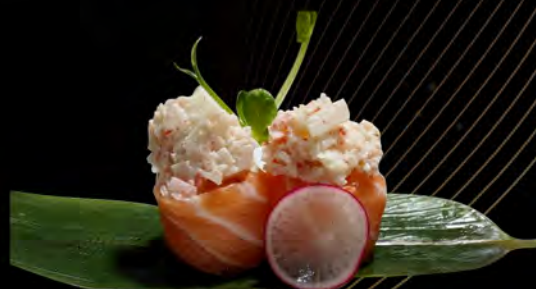
122. SALMONE GRANCHIO € 5,50 salmone all'esterno con granchio surimi e maionese salmon outside with crab surimi and mayonnaise allergeni: 1,2,3,4