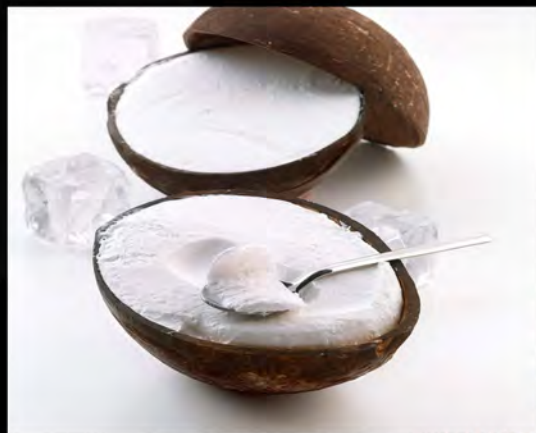
COCCO RIPIENO € 7,00 stuffed coconut