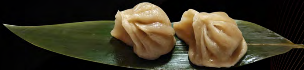
13. RAVIOLI DI CARNE € 4,50 dumpling filled with meat allergeni: 1,6,14