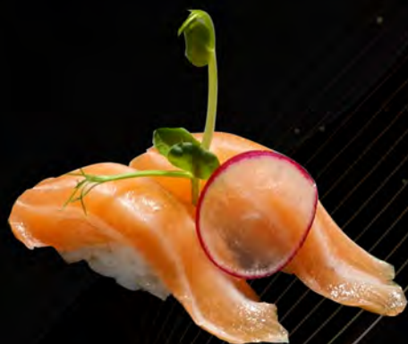
108. SALMONE € 4,00 salmon allergeni: 4