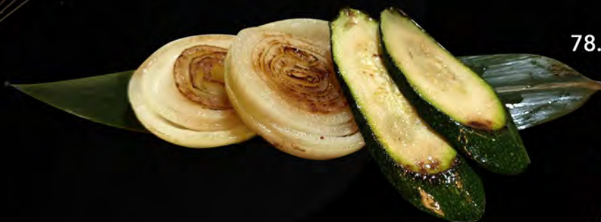
78. VERDURE € 5,00 cipolla, zucchini semi di sesamo con salsa teriyaki onion, courgettes sesame seeds with teriyaki sauce allergeni: 6,11