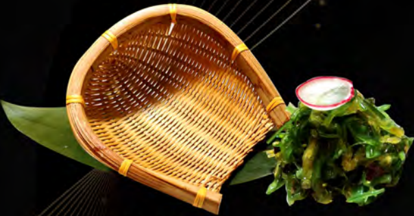
03. WAKAME € 5,00 allergeni: 11