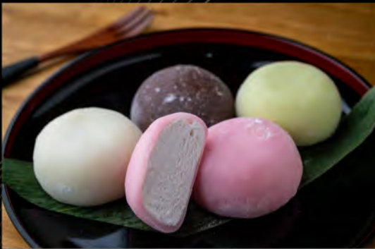
MOCHI GELATO € 6,00 mochi ice cream