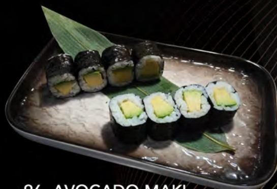
96. AVOCADO MAKI € 4,00