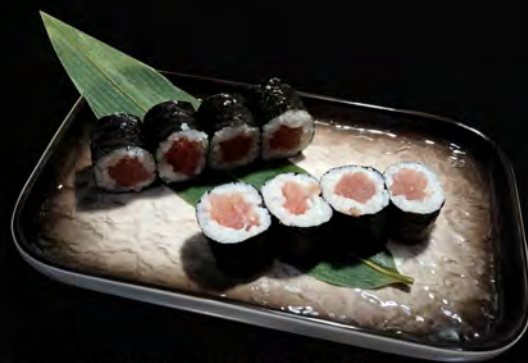
94. TEKKA MAKI € 4,50 tonno tuna allergeni: 4