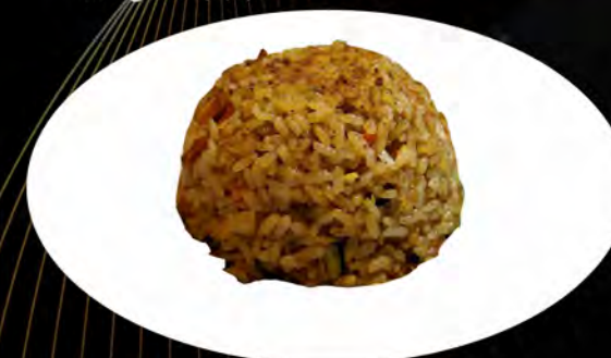
29. RISO SALTATO CON CURRY

€ 5,00 verdure, uova vegetables, eggs allergeni: 3