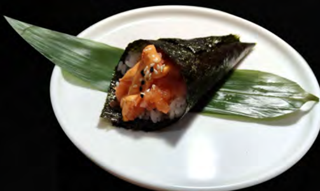
103. SPICY SALMONE € 4,50 tartare di salmone, salsa piccante maionese, semi di sesamo salmon tartare, spicy sauce mayonnaise, sesame seeds allergeni: 3,4,11