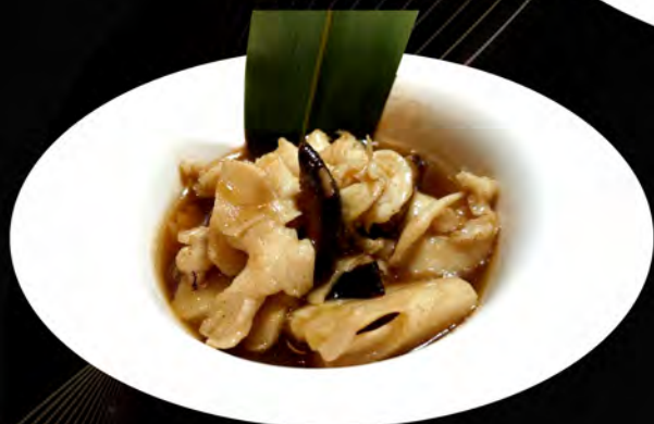
44. POLLO CON BAMBU FUNGHI CINESI chicken with bamboo Chinese mushrooms € 6,00 allergeni: 1,6,14