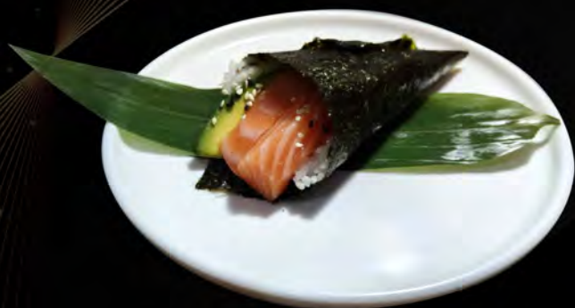
104. SALMONE AVOCADO avocado salmon € 4,50 allergeni: 4,11