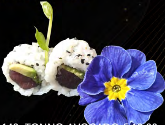
140. TONNO AVOCADO € 10,00 tonno,avocado,sesamo tuna, avocado, sesame allergeni: 4,11