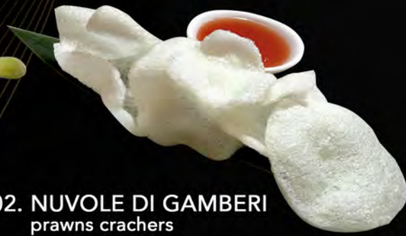
02. NUVOLE DI GAMBERI prawns crackers € 2,50 allergeni: 1,2