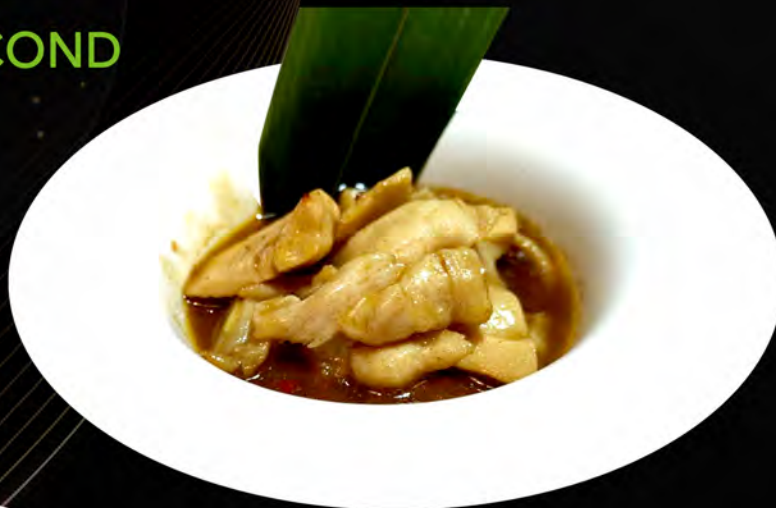
45. POLLO AL CURRY € 6,00 chicken with curry allergeni: