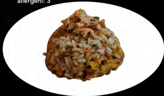
26. RISO SALTATO CON SALMONE E VERDURE

€ 6,00 gamberi, verdure, uovo shrimp, vegetables, egg allergeni: 2,3