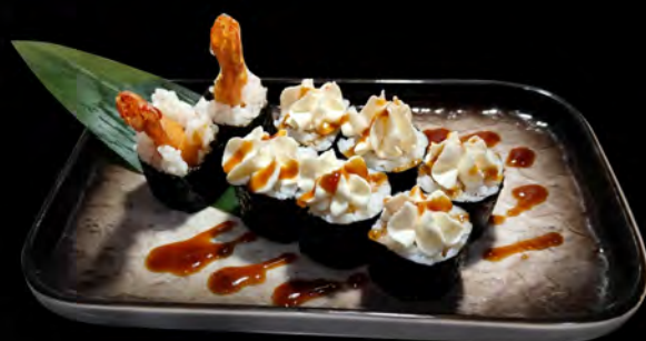
97. EBITEN MAKI € 5,00 gamberi fritti, fili di pasta philadelphia teriyaki fried shrimp, crispy stands of pasta philadelphia teriyaki allergeni: 1,2,6,7