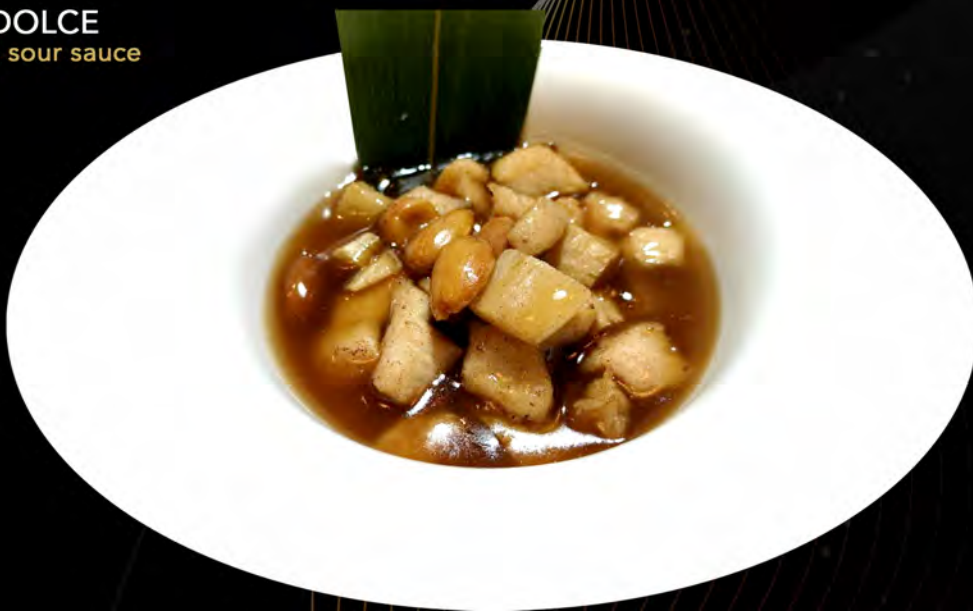
48. POLLO ALLE MANDORLE chicken at almonds € 6,00 allergeni: 1,6,8,14