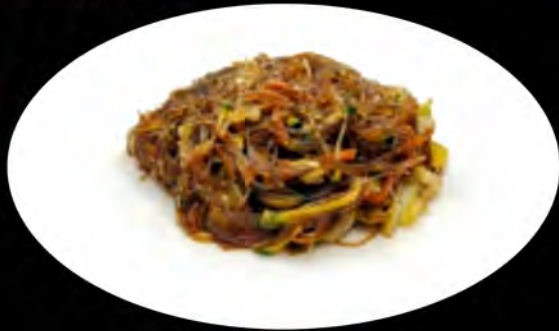
36. SPAGHETTI DI SOIA SALTATI CON VERDURE € 5,00 verdure soia noodles with vegetables allergeni: 1,6,14