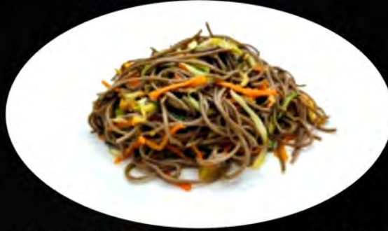
33. YAKI SOBA SALTATO CON VERDURE € 6,00 spaghetti di grano saraceno,verdure,uova buckwheat spaghetti,vegetables, eggs allergeni: 1,2,3,4,5,7,8,11