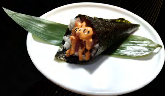
102. SPICY TUNA € 5,00 tartare di tonno, salsa piccante maionese, semi di sesamo tuna tartare, spicy sauce mayonnaise, sesame seeds allergeni: 3,4,11