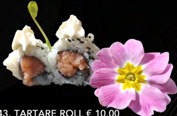
143. TARTARE ROLL € 10,00 tartare di salmone,philadelphia semi di sesamo Salmon Tartare,philadelphia Sesame seeds allergeni: 4,7,11