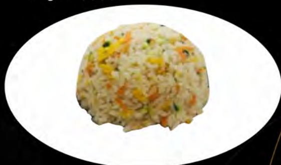
28. RISO SALTATO CON VERDURE

€ 6,00 pollo, gamberi, verdure, uova, salsa di soia chicken, shrimps, vegetables, eggs, soy sauce allergeni: 1,2,3,6