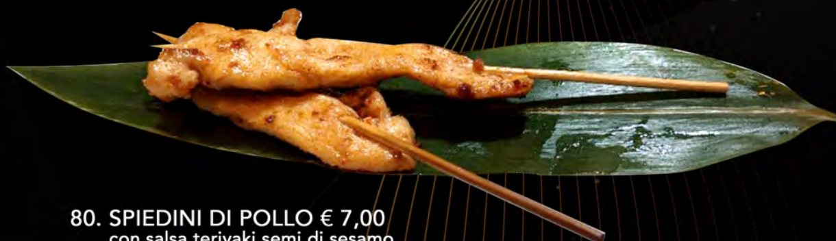
80. SPIEDINI DI POLLO € 7,00 con salsa teriyaki, semi di sesamo grilled chicken skewer with teriyaki sauce, sesame seeds allergeni: 6,11