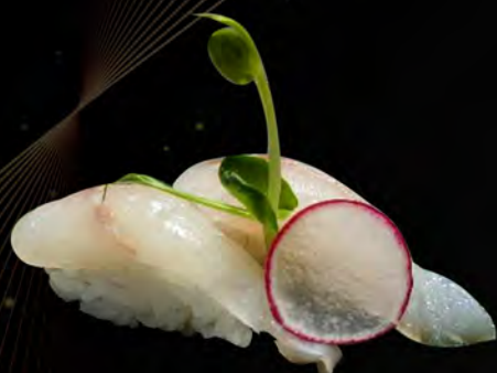
110. BRANZINO € 3,00 seabass allergeni: 4