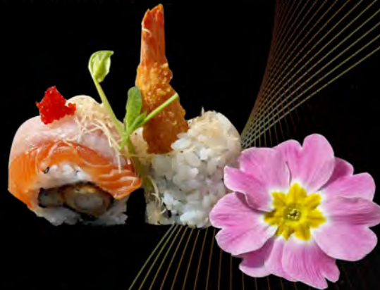
152. TIGER ROLL € 13,00 gambero fritto con all'esterno salmone,branzino tobiko maionese,salsa teriyaki fritti di pasta croccante semi di sesamo fried shrimps with outside salmon, tobiko sea bass mayonnaise, teriyaki sauce crispy stands of pasta Sesame seeds allergeni: 1,2,3,4,6,11