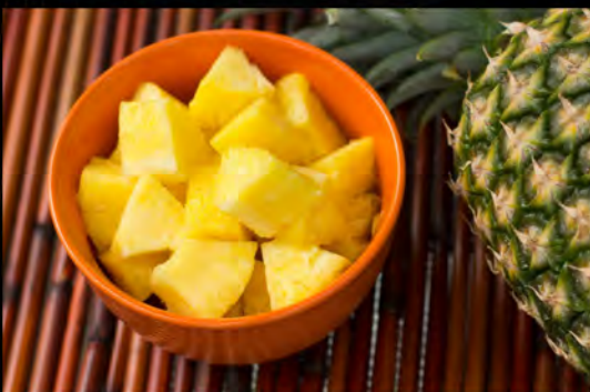
ANANAS FRESCO € 4,50 fresh pineapple