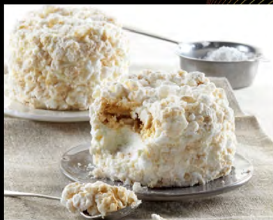
MERINGATA € 6,00 meringue