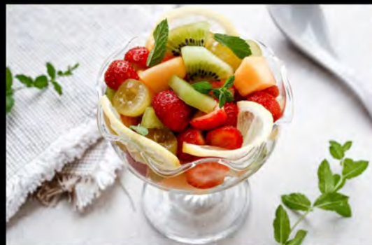
MACEDONIA DI FRUTTA € 5,00 Catalan cream