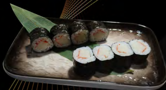
98. KANI MAKI € 4,00 granchio surimi surimi crab allergeni: 1,2