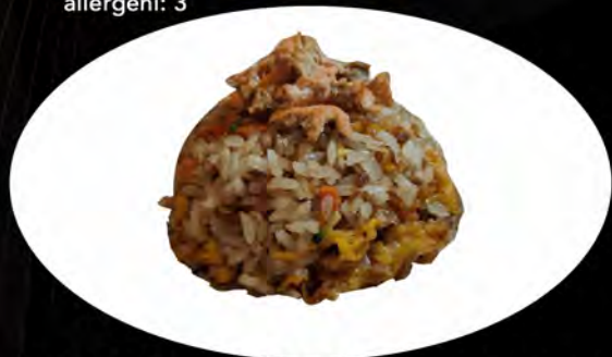
26. RISO SALTATO CON SALMONE E VERDURE

gamberi, verdure, uovo shrimp, vegetables, egg allergeni: 2,3