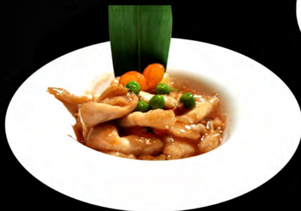
46. POLLO IN AGRODOLCE Chicken in Sweet and sour sauce € 6,00 allergeni: