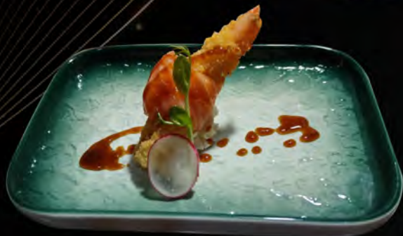
87. SHRMPs FLOWR € 4,00 salmone avvolto in gambero fritto philadelphia salmon wrapped in fried shrimp and philadelphia allergeni: 1,2,3,4,6