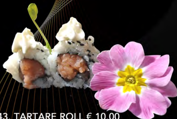
143. TARTARE ROLL € 10,00 tartare di salmone, philadelphia semi di sesamo Salmon Tartare, philadelphia Sesame seeds allergeni: 4,7,11