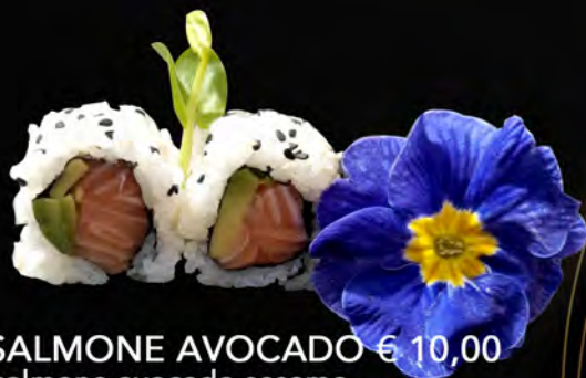
139. SALMONE AVOCADO € 10,00 salmone, avocado, sesamo salmon, avocado, sesame allergeni: 4,11