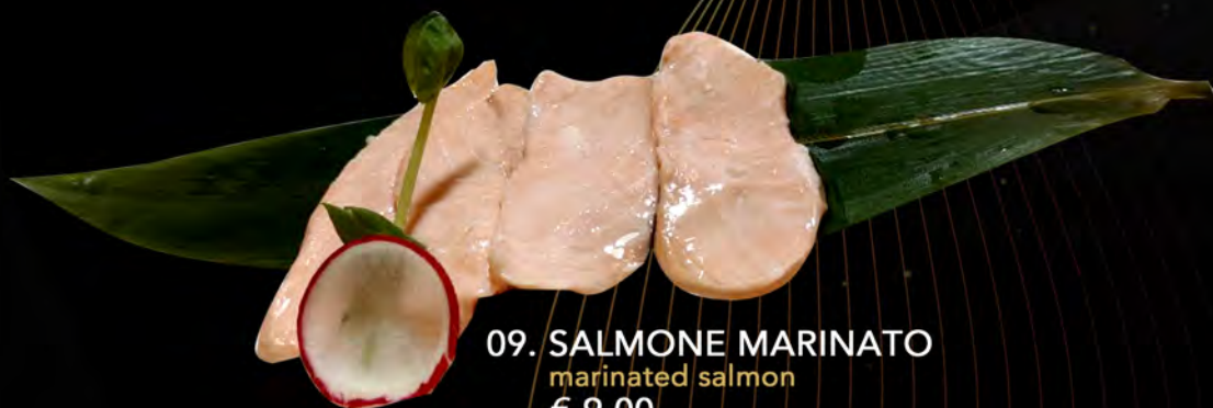
09. SALMONE MARINATO marinated salmon € 9,00 allergeni: 4