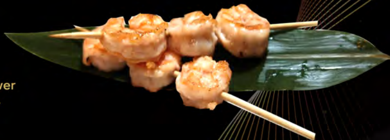
79. SPIEDINI DI GAMBERI € 8,00 con salsa teriyaki, semi di sesamo grilled shrimp skewer with teriyaki sauce, Sesame seeds allergeni: 2,6,11