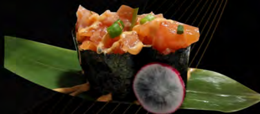
116. SPICY SALMONE € 4,00 tartare di salmone, salsa piccante, erba cipollina Salmon Tartare, spicy sauce, chives allergeni: 3,4