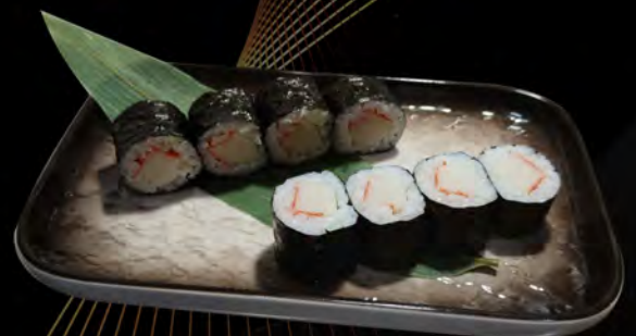
98. KANI MAKI € 4,00 granchio surimi surimi crab allergeni: 1,2