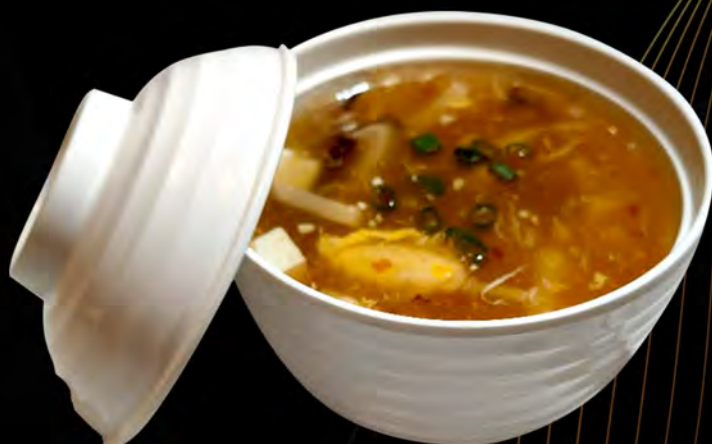
21. ZUPPA PECHINESE € 5,00 uova, funghi, bambu, erba, cipollina eggs, mushrooms, bamboo, chives allergeni: 1,3,6,14