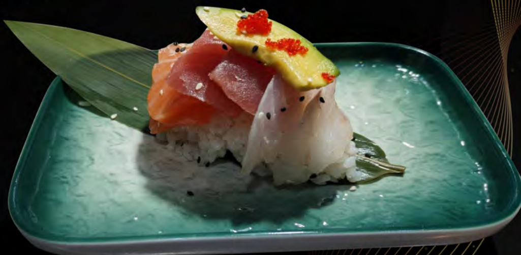
130. MISTO RAW € 11,00 riso, tonno, salmone, branzino, avocado tobiko, semi di sesamo rice, tuna, salmon, sea bass, tobiko avocado, sesame seeds allergeni: 4,11