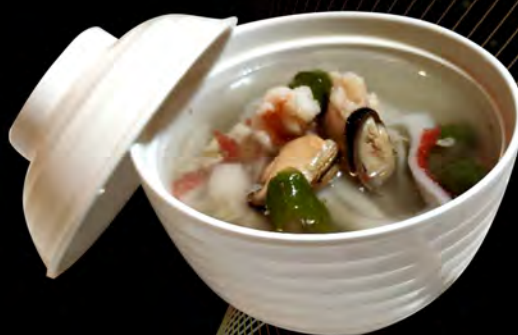
20. UMI SOUP € 5,00 asparagi, surimi di granchio, gamberi cozze asparagus, crab surimi, shrimps mussels allergeni: 1,2,3,6,14