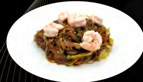
37. SPAGHETTI DI SOIA SALTATI CON GAMBERI E VERDURE € 5,50 gamberi, verdure soia noodles with shrimp, vegetables allergeni: 1,4,6,14