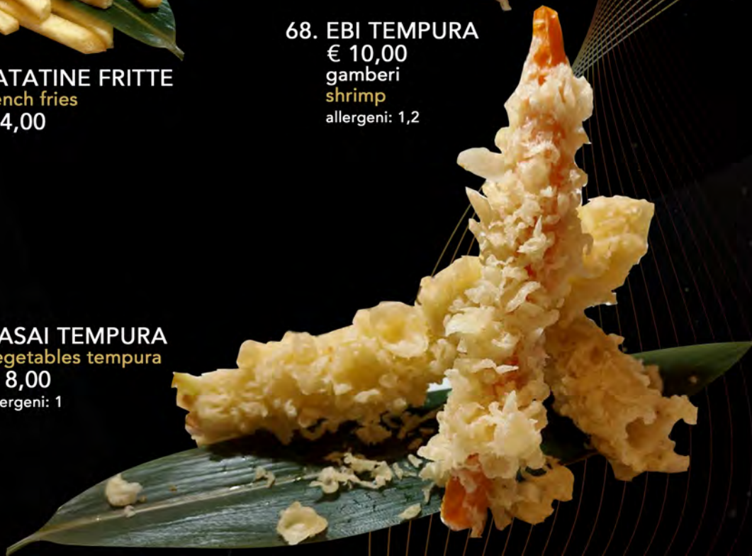
69. YASAI TEMPURA vegetables tempura € 8,00 allergeni: 1