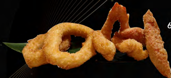
66. FRUTTI DI MARE FRITTO € 9,00 gamberi, surimi di granchio, totani shrimps, crab surimi, squid allergeni: 1,2,3,4,14