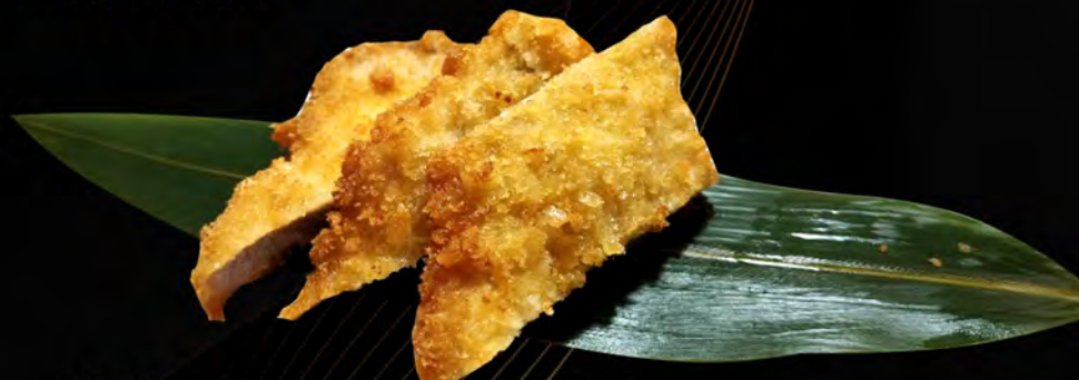
65. COTOLETTA DI SUINO € 8,00 pork cutlet allergeni: 1,3