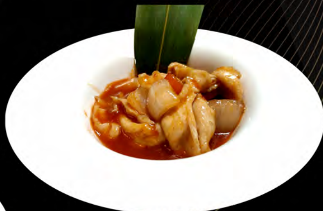
47. POLLO IN SALSA CHILI chicken in chili sauce € 6,00 allergeni: 14