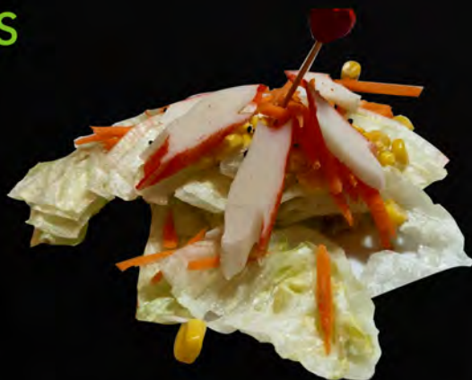
06. INSALATA CON SURIMI DI GRANCHIO € 6,00 insalata mista con surimi di granchio e salsa giapponese mixed salad with surimi di crab and Japanese sauce allergeni: 1,2,6,11