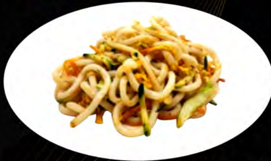
30. YAKI UDON SALTATO CON VERDURE € 6,00 verdure, uova vegetables, eggs allergeni: 1,2,3,4,5,7,8,11