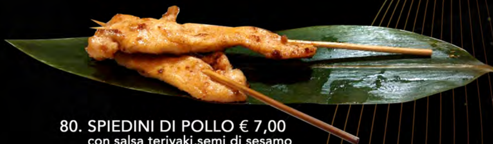
80. SPIEDINI DI POLLO € 7,00 con salsa teriyaki, semi di sesamo grilled chicken skewer with teriyaki sauce, sesame seeds allergeni: 6,11