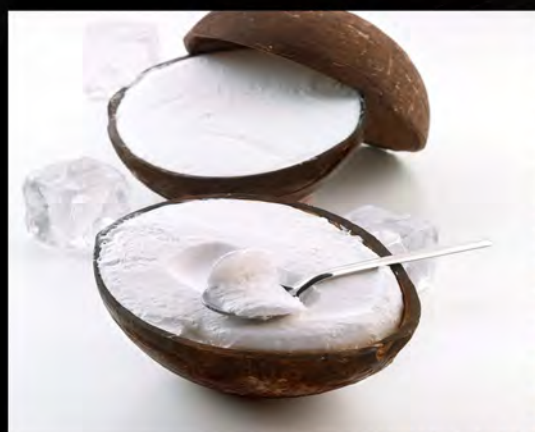
COCCO RIPIENO € 7,00 stuffed coconut