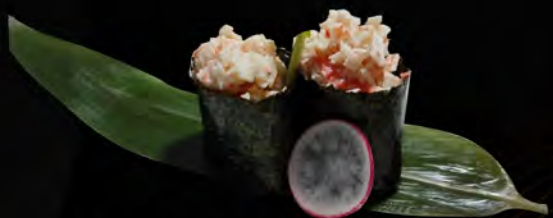
119. GRANCHIO € 4,00 granchio, surimi, maionese crab, surimi, mayonnaise allergeni: 1,2,3