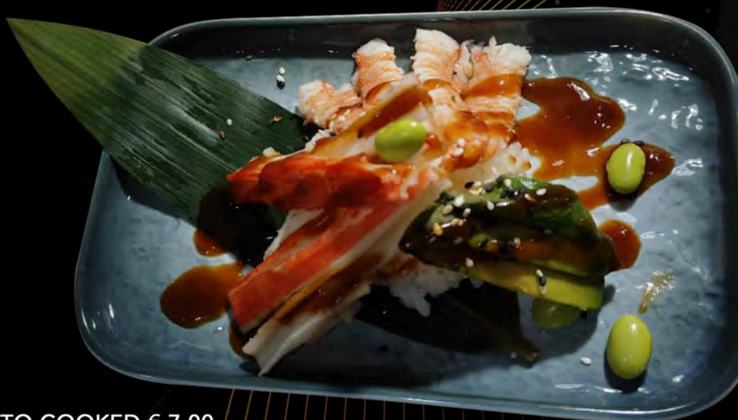
131. MISTO COOKED € 7,00 gamberi cotto, granchio surimi, avocado fagioli di soia teriyaki, semi di sesamo cooked shrimps, surimi crab, avocado teriyaki soybeans, sesame seeds allergeni: 1,2,6,11,14