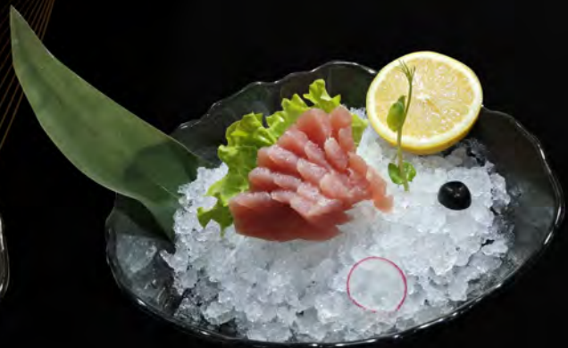
171. TONNO € 14,00 tuna allergeni: 4