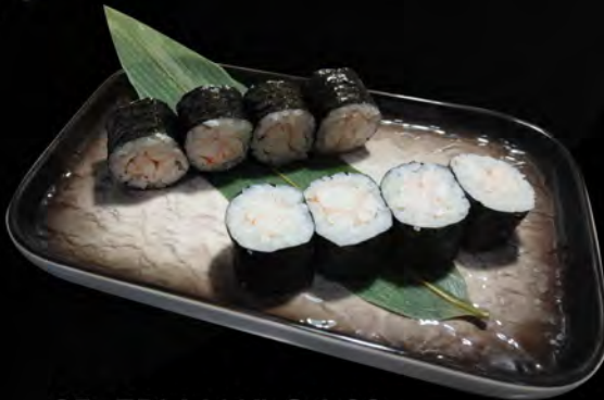
95. EBI MAKI € 4,00 gambero cotto cooked shrimp allergeni: 2