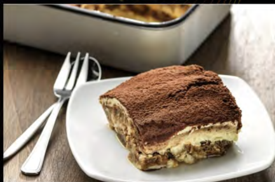
TIRAMISÙ DELLA CASA