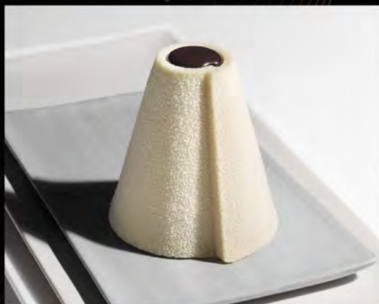
GIROTONDO ALLE MANDORLE € 7,00 almond cake