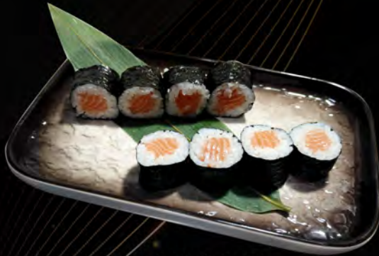
93. SAKE MAKI € 4,50 salmone salmon allergeni: 4