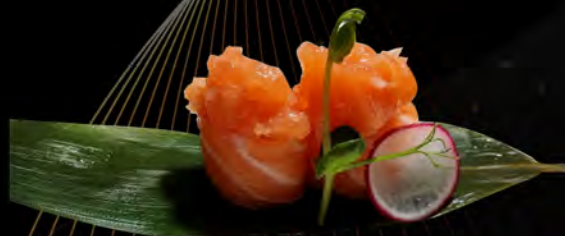
123. SALMONE OUT € 5,50 salmone all'esterno con tartare di salmone salmon on the outside with Salmon Tartare allergeni: 4