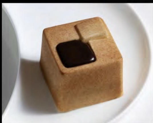
CUBO AI DUE CIOCCOLATO € 7,00 two chocolate cube