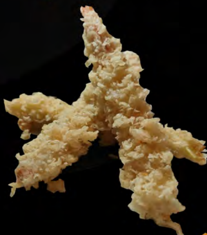
68. EBI TEMPURA € 10,00 gamberi shrimp allergeni: 1,2