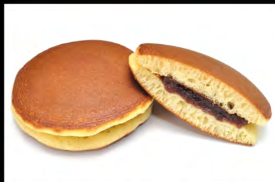
DORAYAKI CON NUTELLA