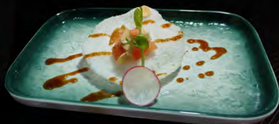
88. SALMON ON THE CLODS € 3,00 nuvole di gamberi, tartare salmone salsa teriyaki e mandorle croccanti prawns crackers, salmon tartare teriyaki sauce and crunchy almonds allergeni: 1,2,4,6,8