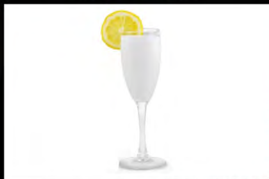
SORBETTO AL LIMONE