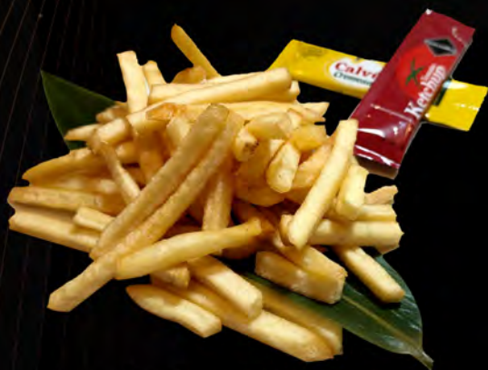
67. PATATINE FRITTE french fries € 4,00