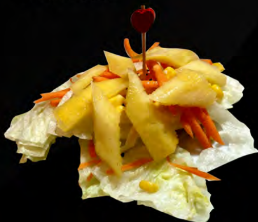
07. INSALATA CON MANGO € 6,00 mixed salad with mango and mango sauce allergeni: 3