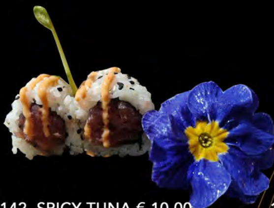
142. SPICY TUNA € 10,00 tartare di tonno, salsa piccante maionese, semi di sesamo tuna tartare, spicy sauce mayonnaise, sesame seeds allergeni: 3,4,11