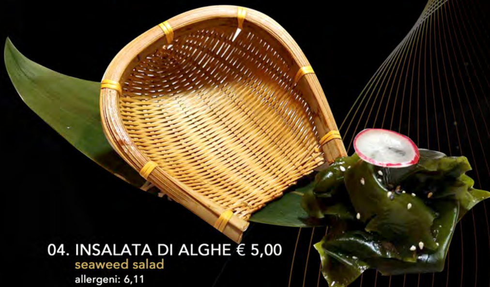
04. INSALATA DI ALGHE € 5,00 seaweed salad allergeni: 6,11