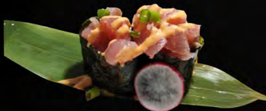
117. SPICY TUNA € 4,00 tartare di tonno, salsa piccante erba cipollina tuna tartare, spicy sauce chives allergeni: 3,4