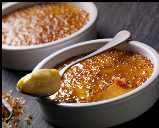
CREMA CATALANA € 6,00 Catalan cream