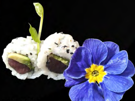
140. TONNO AVOCADO € 10,00 tonno, avocado, sesamo tuna, avocado, sesame allergeni: 4,11