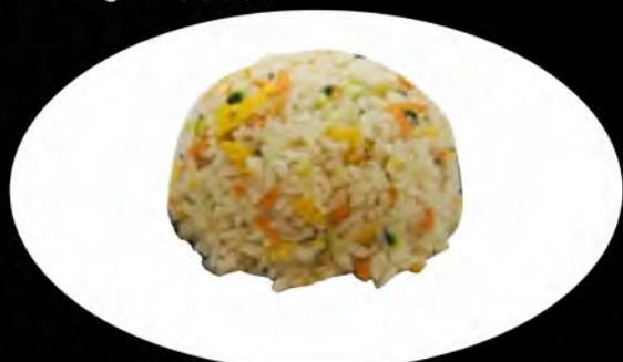
28. RISO SALTATO CON VERDURE

pollo, gamberi, verdure, uova, salsa di soia chicken, shrimps, vegetables, eggs, soy sauce allergeni: 1,2,3,6