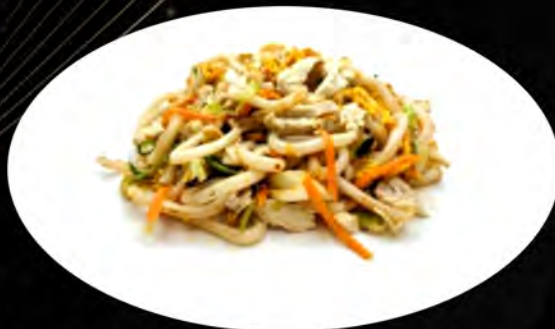
32. YAKI UDON SALTATO CON POLLO E VERDURE € 7,00 verdure, pollo, uova vegetables, chicken, eggs allergeni: 1,2,3,4,5,7,8,11