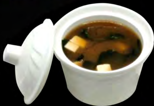
19. ZUPPA MISO € 5,00 tou-fu, alghe tofu, seaweed allergeni: 1