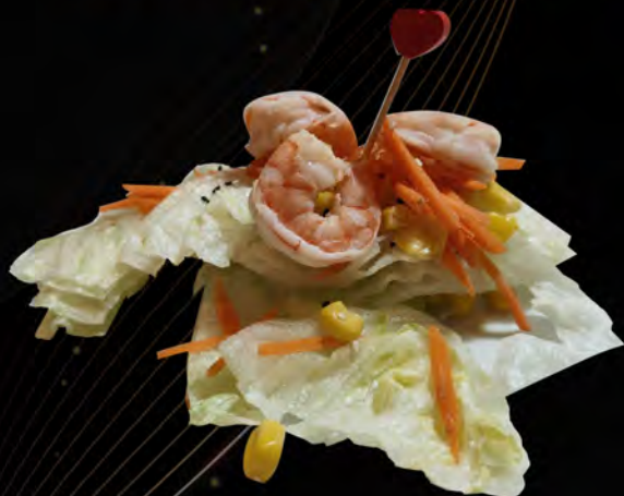
05. INSALATA CON GAMBERI € 7,00 insalata mista con gamberi e salsa giapponese mixed salad with shrimps and Japanese sauce allergeni: 1,2,6,11