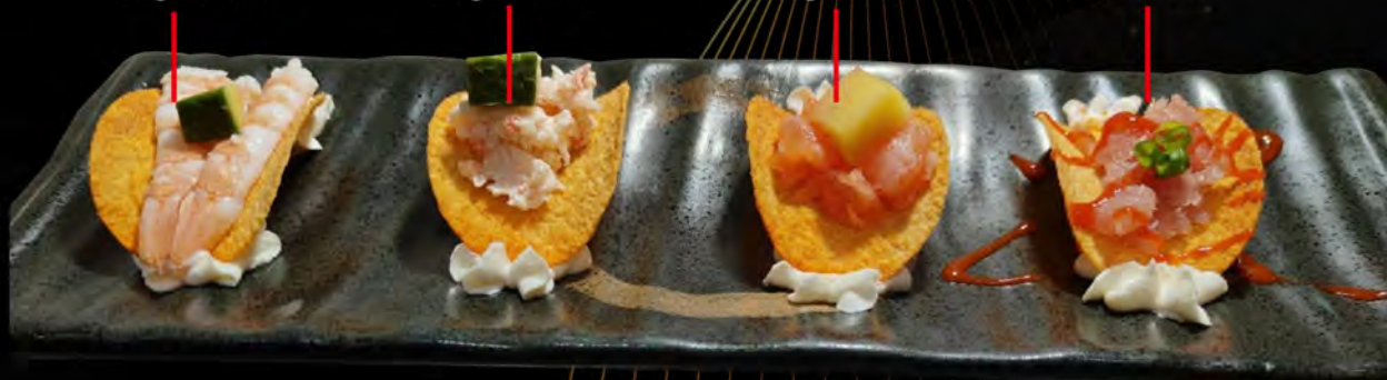
92. TAKITO TUNA € 3,50 chips, tartare di tonno, philadelphia erba cipollina, salsa piccante chips, tuna tartare, philadelphia chives, spicy sauce allergeni: 1,4,7