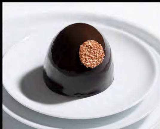
VENERE NERA € 7,00 black venus