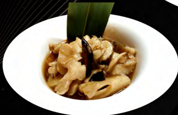
44. POLLO CON BAMBU FUNGHI CINESI chicken with bamboo Chinese mushrooms € 6,00 allergeni: 1,6,14