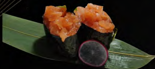
118. SALMONE € 4,00 tartare di salmone Salmon Tartare allergeni: 4