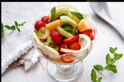
MACEDONIA DI FRUTTA