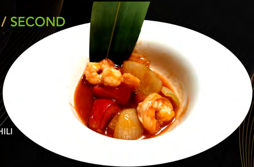
49. GAMBERI IN SALSA CHILI shrimp in chili sauce € 7,00 allergeni: 1