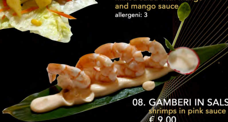
08. GAMBERI IN SALSA ROSA shrimps in pink sauce € 9,00 allergeni: 2,3