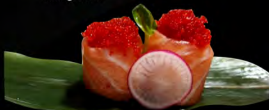
120. SALMONE TOBIKO € 6,50 salmone, all'esterno con uova di pesce volante salmon, outside with flying fish roe allergeni: 4