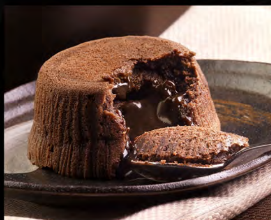
SOUFFLÉ AL CIOCCOLATO € 6,00 Chocolate soufflé