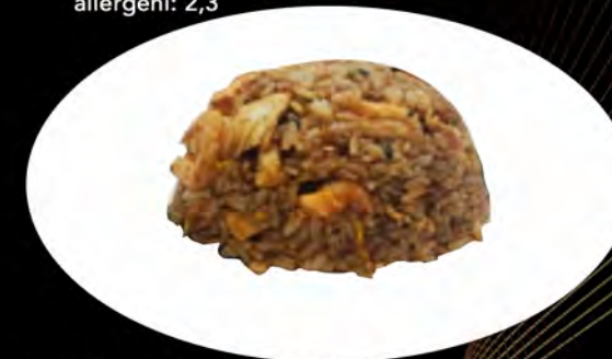
27. RISO SALTATO CAO LAW FAN

salmone, verdure, uovo salmon, vegetables, egg allergeni: 1,3,4,6,14