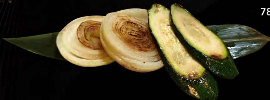
78. VERDURE € 5,00 cipolla, zucchini semi di sesamo con salsa teriyaki onion, courgettes sesame seeds with teriyaki sauce allergeni: 6,11