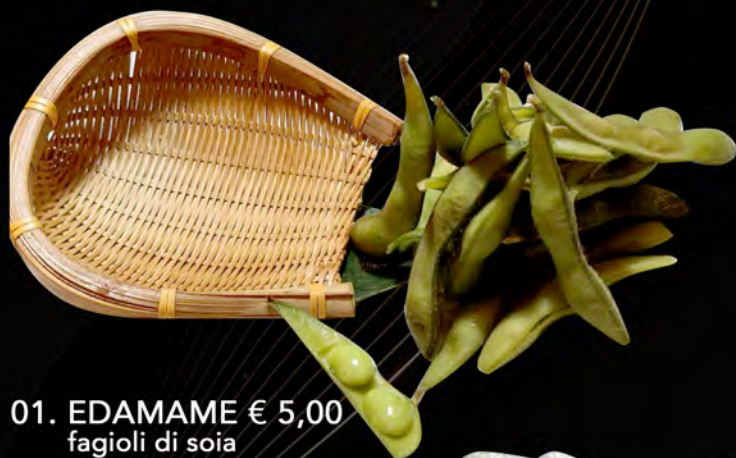
01. EDAMAME € 5,00 fagioli di soia soybeans allergeni: 6