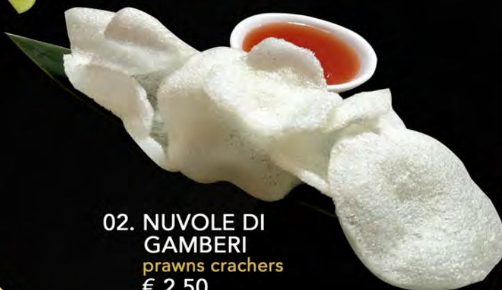
02. NUVOLE DI GAMBERI prawns crackers € 2,50 allergeni: 1,2