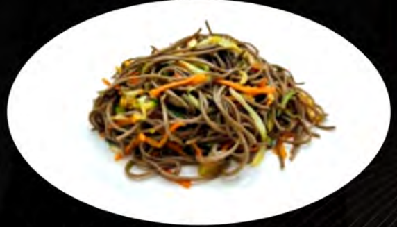
33. YAKI SOBA SALTATO CON VERDURE € 6,00 spaghetti di grano saraceno, verdure, uova buckwheat spaghetti, vegetables, eggs allergeni: 1,2,3,4,5,7,8,11