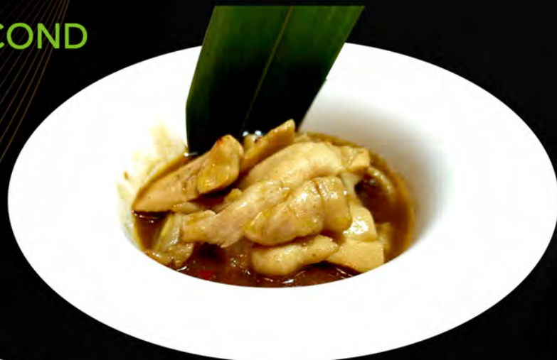
45. POLLO AL CURRY € 6,00 chicken with curry allergeni: