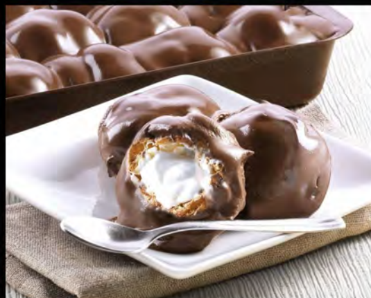
PROFITEROLES € 6,00 profiteroles