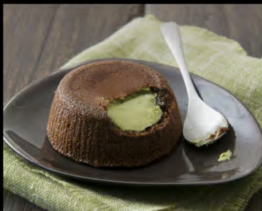
SOUFFLÉ AL PISTACCHIO € 6,00 pistachio soufflé