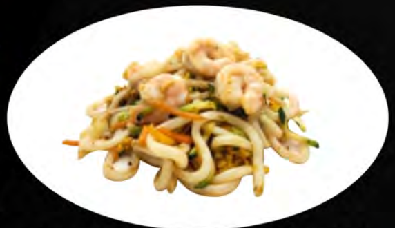
31. YAKI UDON SALTATO CON GAMBERI E VERDURE € 7,00 verdure, gamberi, uova vegetables, shrimps, eggs allergeni: 1,2,3,4,5,7,8,11