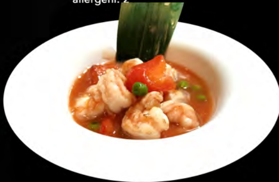
52. GAMBERI IN AGRODOLCE shimps in bitter-sweet € 7,00 allergeni: 2