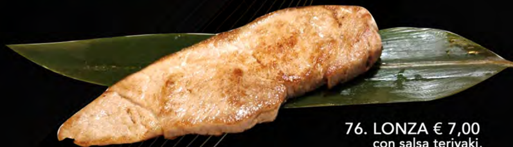
76. LONZA € 7,00 con salsa teriyaki, semi di sesamo pork loin with teriyaki sauce, Sesame seeds allergeni: 6,11