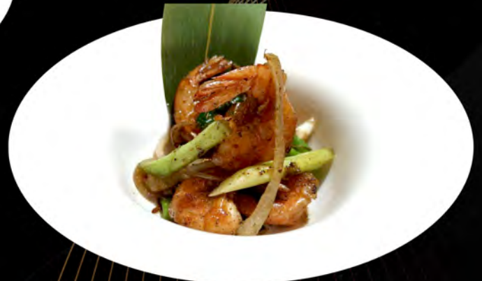
53. GAMBERI SALTATI SALE E PEPE sautéed shrimp salt and pepper € 7,00 allergeni: 2