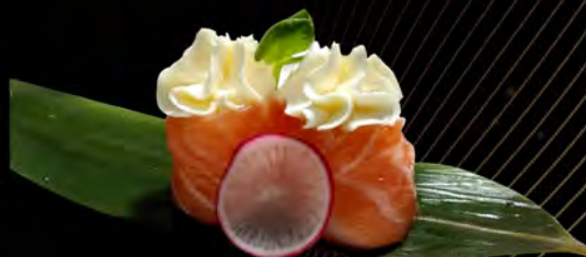
121. SALMONE PHILADELPHIA € 5,00 salmone all'esterno con philadelphia salmon outside with philadelphia allergeni: 4,7