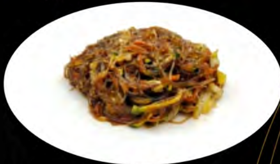
36. SPAGHETTI DI SOIA SALTATI CON VERDURE € 5,00 verdure soia noodles with vegetables allergeni: 1,6,14