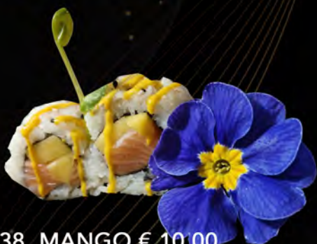
138. MANGO € 10,00 salmone, mango, semi di sesamo salsa mango salmon, mango, Sesame seeds mango sauce allergeni: 3,4,11