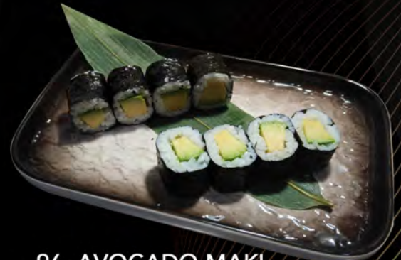
96. AVOCADO MAKI € 4,00