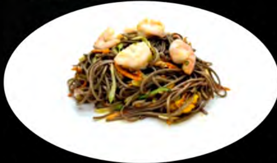
34. YAKI SOBA SALTATO CON GAMBERI E VERDURE € 7,00 spaghetti di grano saraceno, verdure, gamberi, uova buckwheat spaghetti, vegetables, shrimp, eggs allergeni: 1,2,3,4,5,7,8,11