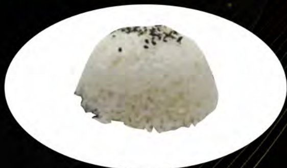
22. RISO BIANCO € 2,50