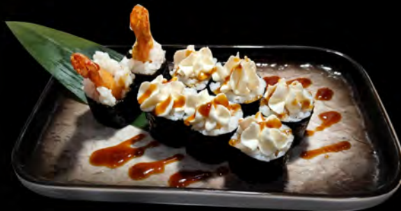
97. EBITEN MAKI € 5,00 gamberi fritti, fili di pasta philadelphia teriyaki fried shrimp, crispy stands of pasta philadelphia teriyaki allergeni: 1,2,6,7