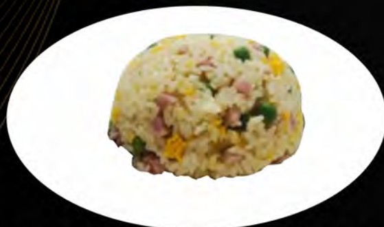
23. RISO ALLA CANTONESE € 5,50

prosciutto, piselli, uova ham, peas, eggs allergeni: 1,3