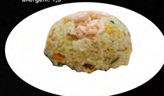
25. RISO SALTATO CON GAMBERI E VERDURE

pollo, verdure, uovo chicken, vegetables, egg allergeni: 3