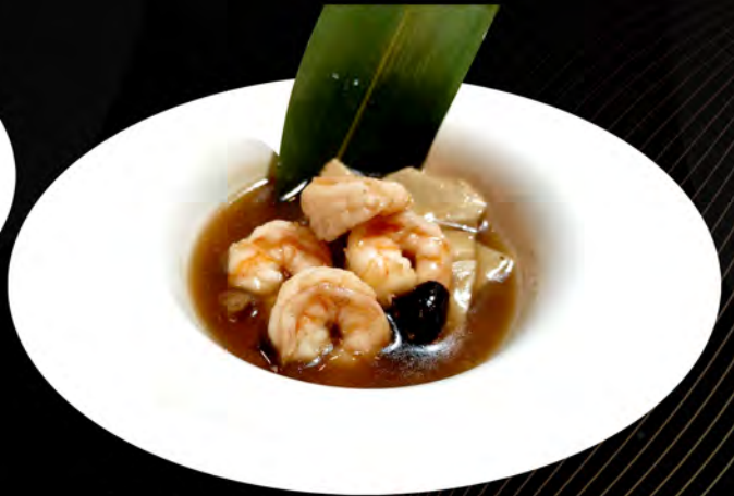
51. GAMBERI CON BAMBU E FUNGHI shrimp with bamboo and mushrooms € 7,00 allergeni: 1,2,6,14