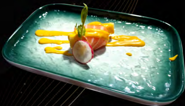
86. MANGO FLOWER € 4,00 salmone, avvolto in mango con la salsa mango salmon, wrapped in mango with mango sauce allergeni: 3,4