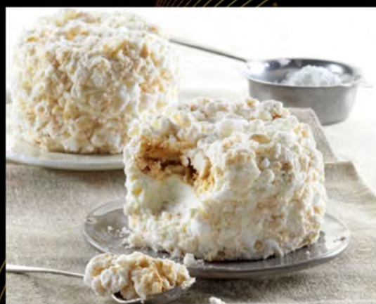
MERINGATA € 6,00 meringue