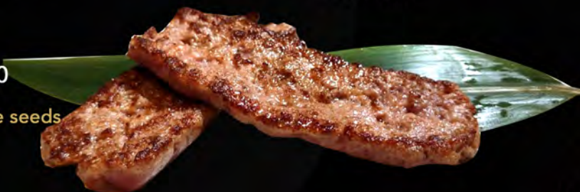
77. SALSICCIA € 7,00 con semi di sesamo sausage with sesame seeds allergeni: 1