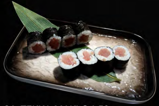
94. TEKKA MAKI € 4,50 tonno tuna allergeni: 4