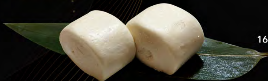
16. PANE CINESE AL VAPORE Chinese bread steamed € 4,00 allergeni: 1