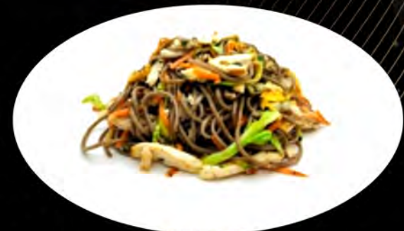
35. YAKI SOBA SALTATO CON POLLO E VERDURE € 7,00 spaghetti di grano saraceno, verdure, pollo, uova buckwheat spaghetti, vegetables, chicken, eggs allergeni: 1,2,3,4,5,7,8,11