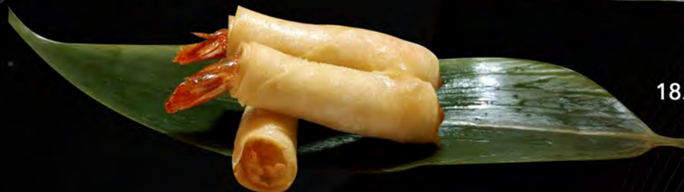
18. INVOLTINI GAMBERI rolls shrimp € 5,50 allergeni: 1,2