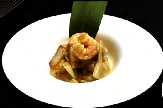
50. GAMBERI AL CURRY Curry Shrimps € 7,00 allergeni: 2