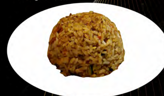
29. RISO SALTATO CON CURRY

verdure, uova vegetables, eggs allergeni: 3