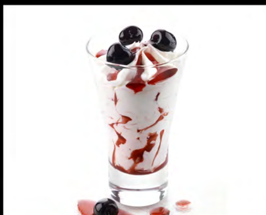
COPPA SPAGNOLA € 6,00 Spanish cup