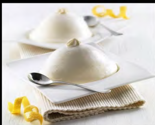
DELIZIA AL LIMONE € 6,00 lemon delight