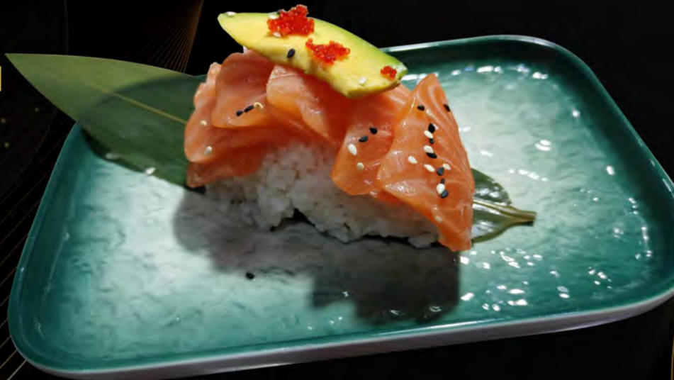
129. SAKE RAW € 11,00 riso, salmone crudo, avocado semi di sesamo, tobiko rice, raw salmon, avocado, sesame seeds, tobiko allergeni: 4,11