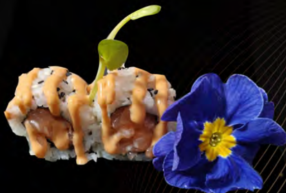
141. SPICY SALMONE € 10,00 tartare di salmone, salsa piccante maionese, semi di sesamo salmon tartare, spicy sauce mayonnaise, sesame seeds allergeni: 3,4,11