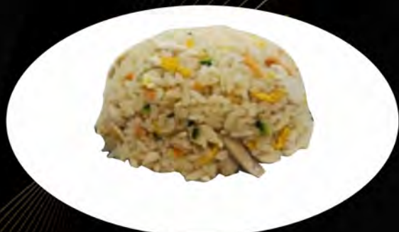
24. RISO SALTATO CON POLLO E VERDURE

prosciutto, piselli, uova ham, peas, eggs allergeni: 1,3