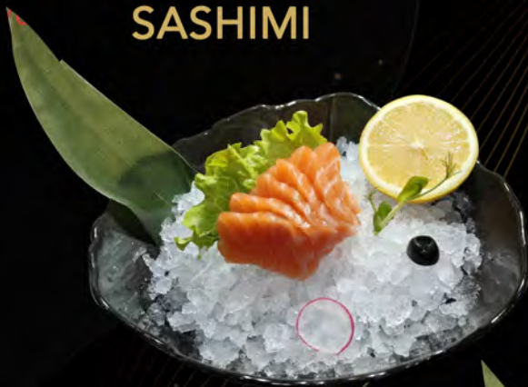
170. SALMONE € 12,00 salmon allergeni: 4