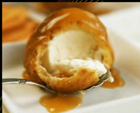
GELATO FRITTO € 5,00 fried ice cream